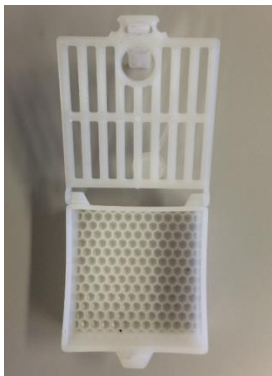
Königinnenkäfig mit abnehmbarem Königinnengitter