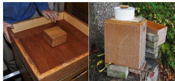
Magazin (2 verschiedene Futtergeschirre)