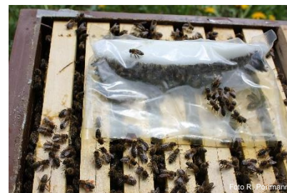
Magazin (Futterteig direkt auf Wabenschenkeln)