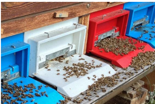
Akute Bienenvergiftung mit massenhaft toten Bienen vor dem Flugloch.