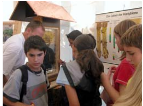
Grossen Anklang fanden unsere Schaukästen und der Wettbewerb: Welche Jahresfarbe hat die Königin im Jahre 2004? Die richtige Antwort war grün. 27 Gewinner durften ein Glas Honig entgegen nehmen.